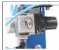
Druckregler zum Einstellen der Balance (Gewicht)