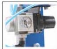
Druckregler zum Einstellen der Balance (Gewicht)