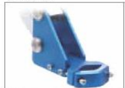
Werkzeughalter universell bis 55 mm Werkzeugdurchmesser