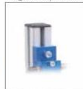
Höhenverstellung des Armes ist möglich