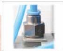
Rückschlagventil verhindert plötzliches absinken