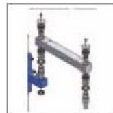
Radial- und Axiallagerung der Haupttraverse