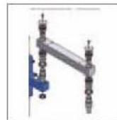
Radial- und Axiallagerung der Haupttraverse