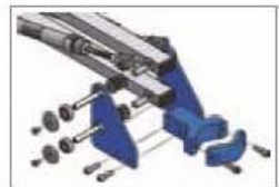
Radial- und Axiallagerung der Hohltraverse