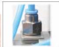
Rückschlagventil verhindert plötzliches absinken