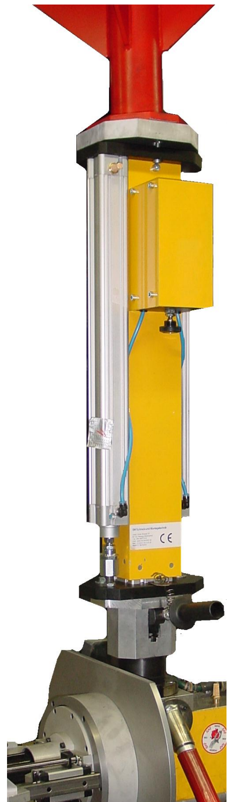
Dremolift für 150Kg mit zwei

Bankverbindung: HypoVereinsbank München BLZ 700 202 70 Kto.Nr. 663604635 Iban: DE03 7002 0270 0663 6046 35 BIC: HYVEDEMMXXX